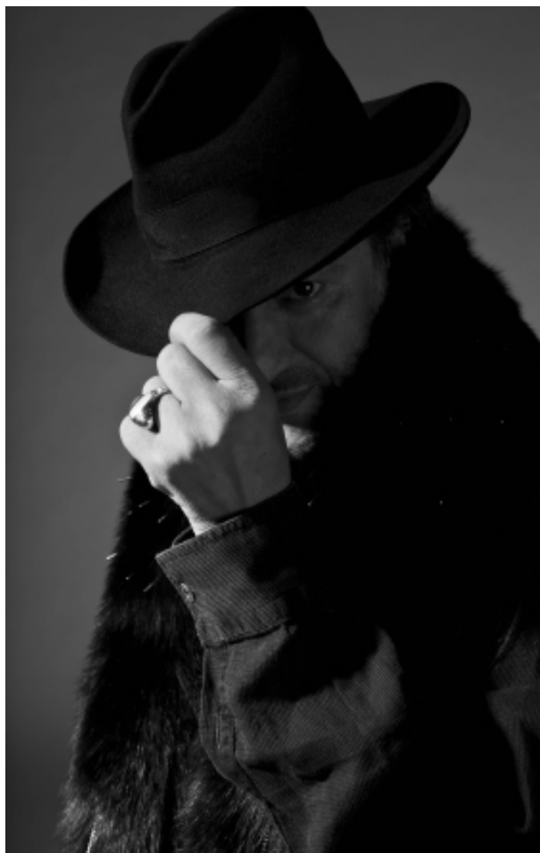
Rachid Taha